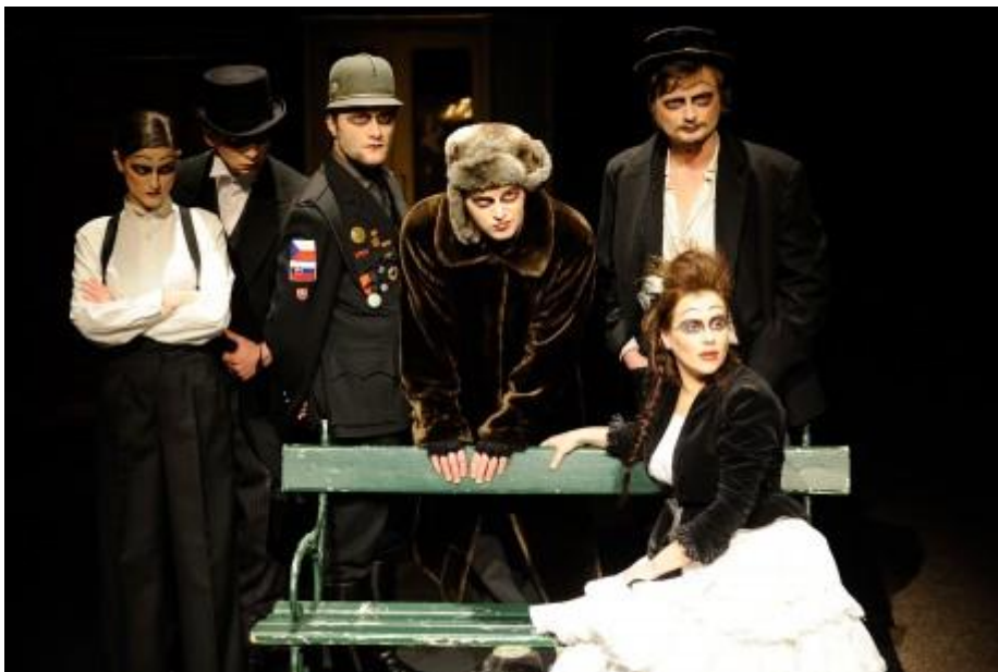
V inscenácii sa objavuje šesť umrlcov.

Slovenská historická pamäť je vo všeobecnosti na dosť nízkej úrovni. Našťastie Slovenské komorné divadlo Martin sa pravidelne venuje téme pripomínania si významných osobností slovenských kultúrnych dejín, pretože zabúdanie na národných hrdinov/buditeľov/kultúrnych dejateľov je u Slovákov už bežným faktom. K inscenáciám, v ktorých si martinskí tvorcovia opäť pútavou divadelnou formou pripomenuli zásluhy, ale aj osobné slasti i strasti niektorých významných osobností sa zaradil aj ojedinelý projekt divadelného sitcomu nazvaný www.narodnycintorin.sk .