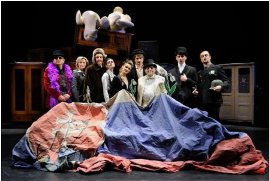
Herci vytvárajú panoptikum živých mŕtvol, kde zvyrazňujú grotesknosť a karikatúru základných povahových či vzťahových čŕt stvárňovaných osobností.