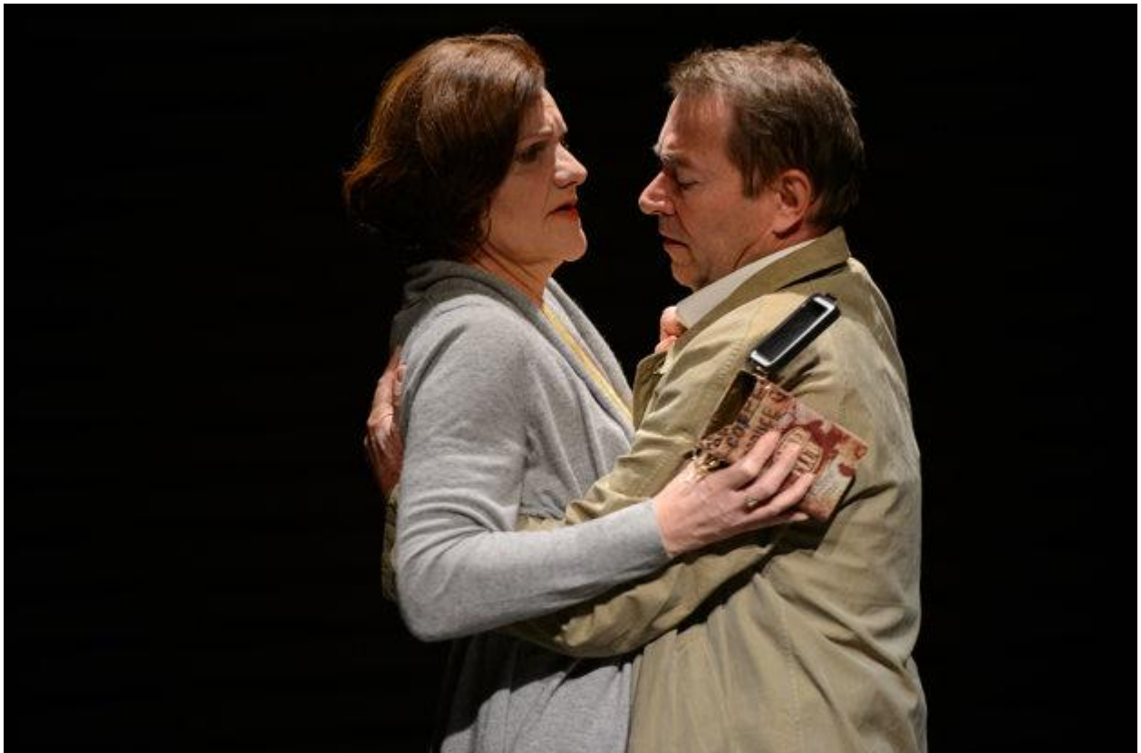
Vtedy v Bratislave v Martine.

Britský dramatik Tom Stoppard označil knihu Žo Langerovej (vyšla koncom 70. rokov) za jedno z najklasickejších svedectiev, ktoré prišli z postkomunistických krajín. Dočkala sa aj reedície, dodnes sa tam o nej v rámci východoeurópskych štúdií učí.